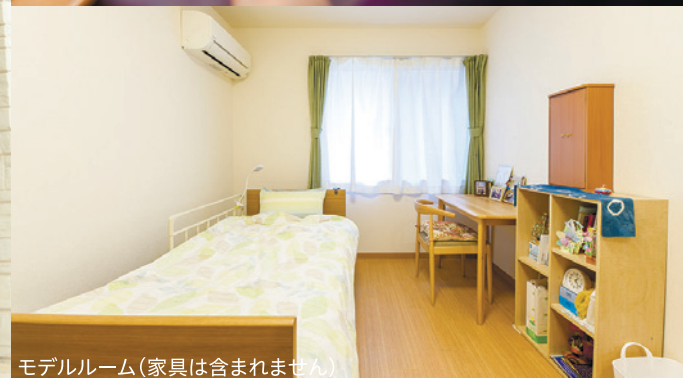
モデルルーム(家具は含まれません)